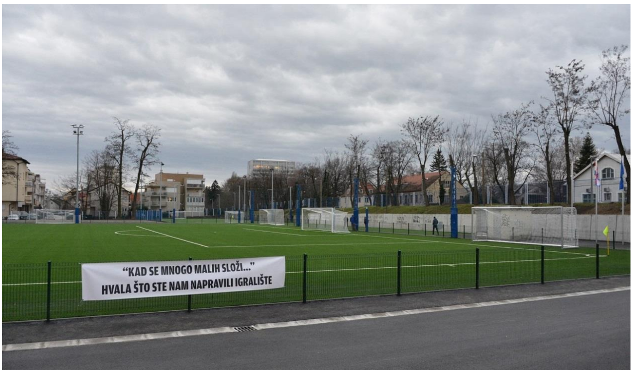
Slika 5: Nogometno igralište Pongračevo

Također, u 2018. su isplaćena sredstva za izradu projekta i stručni nadzor nad radovima te radove sanacije i energetske obnove nogometnih igrališta Sava i Jakuševac u ukupnom iznosu 9.708.722,00 kn, za što je Grad proveo postupke javne nabave.