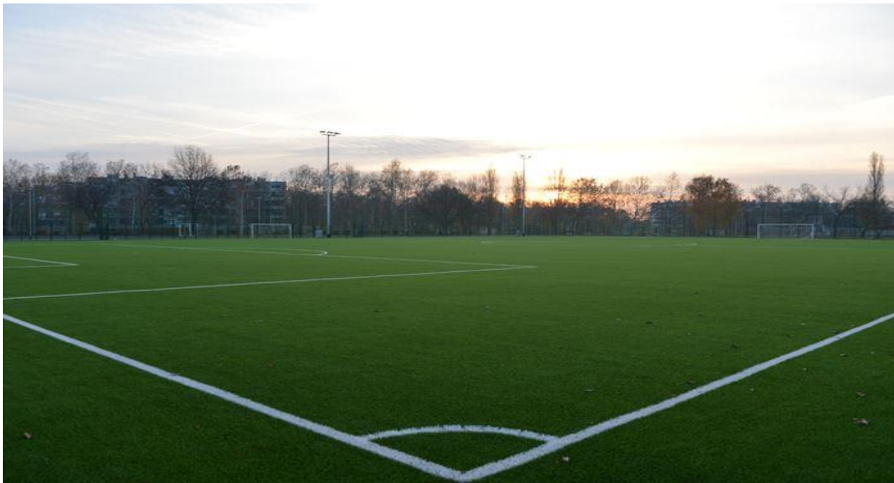
Slika 6: Športsko-rekreacijski centar Grana-Klaka