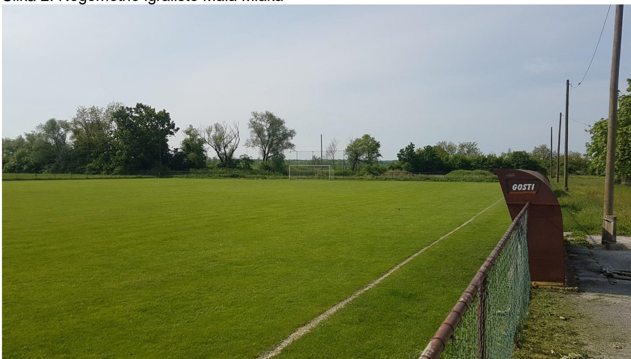
Slika 2: Nogometno igralište Mala Mlaka

Na temelju navedenog Zakona, Gradska skupština Grada je u siječnju 1996. donijela Zaključak o preuzimanju sportskih objekata i drugih nekretnina u vlasništvo Grada Zagreba (Službeni glasnik Grada Zagreba 2/96 i 8/09). Sportski objekti i druge nekretnine utvrđene su u posebnom prilogu koji je sastavni dio navedenog Zaključka.