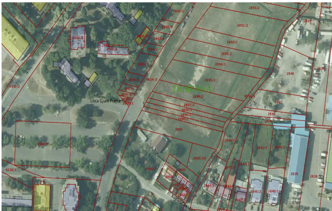
Slika 3: Pregled katastarske čestice na kojoj se nalazi Nogometno igralište Studentski grad

Primjerice, nogometno igralište Studentski grad se prema Zaključku nalazi na katastarskoj čestici 2905/5 k.o. Dubrava (na kojoj je cesta i parkiralište), a prema stvarnom stanju nogometno igralište se nalazi na susjednim katastarskim česticama k.o. Dubrava (upisane u korist Grada) i 9614/3 k.o. Dubrava (upisana kao Javno dobro-put). Prema registru imovine Grada (obrazac Izvještaj o nekretnini), navedeno nogometno igralište nalazi se na katastarskoj čestici 2905/7, odnosno podaci nisu jednaki Zaključku.