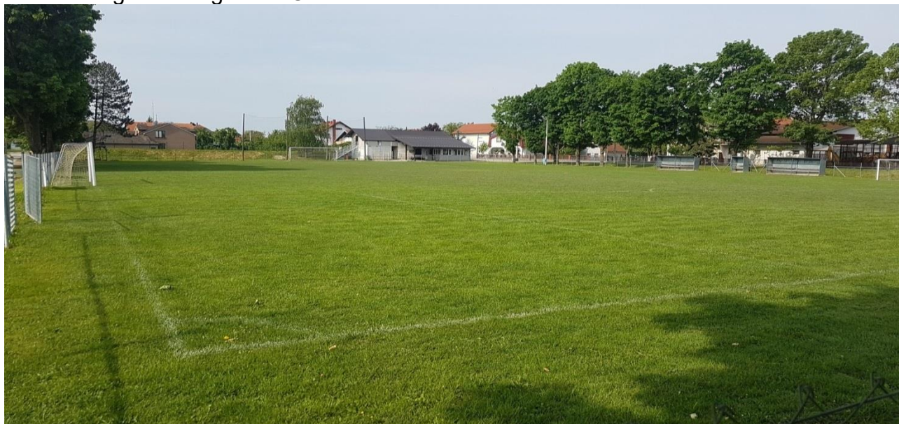
Slika 1: Nogometno igralište Čehi

Prema podacima Grada, na području Grada su koncem 2018. bila 54 nogometna stadiona i igrališta, od čega su, prema podacima iz zemljišnih knjiga, 21 stadion i igralište u vlasništvu Grada, za 16 stadiona i igrališta je upisano više vlasnika (Grad, Republika Hrvatska, upisano kao društveno vlasništvo, Župna nadarbina Hrvatsko akademsko športsko društvo Mladost, upisano kao općenarodna imovina te fizičke osobe), sedam igrališta je u vlasništvu Republike Hrvatske, za tri igrališta je upisano vlasništvo pravnih osoba, tri igrališta su upisana kao društveno vlasništvo te su tri igrališta upisana kao općenarodna imovina. Od 54 nogometna stadiona i igrališta na području Grada, Grad je upravljao s 50, za jedno igralište se vodi imovinskopravni spor (ŠRC Folnegovićevo), za jedno igralište (koje koristi NK Ivanja Reka) se tijekom revizije utvrdilo da je u vlasništvu Grada, dok su dva igrališta (koje koriste NK Devetka i NK Ravnice) u vlasništvu i pod upravljanjem pravnih osoba.